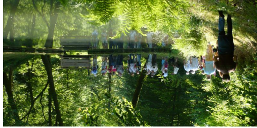
TOP Rinntal - Triftweg