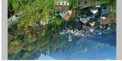
TOP Rinnthal - Herzelweg